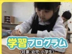
学習プログラム (対象: 幼児・小学生)

「読み・書き・計算」を繰り返し勉強することで、基礎学力を身につけ、自学自習の習慣付けを促します。