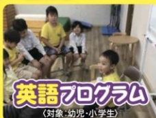
英語プログラム (対象: 幼児・小学生)

「読み・書き・計算」を繰り返し勉強することで、基礎学力を身につけ、自学自習の習慣付けを促します。