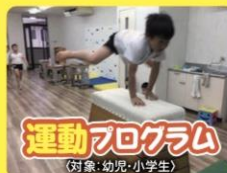
運動プログラム (対象: 幼児・小学生)

Annie Jr.イングリッシュの質の高いレッスンプログラムを毎日受講できます。