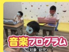
音楽プログラム (対象: 幼児)

「走る」「跳ぶ」「投げる」「蹴る」などの基本的な動きをバランスよく組み入れ、「体の力」を育てます。