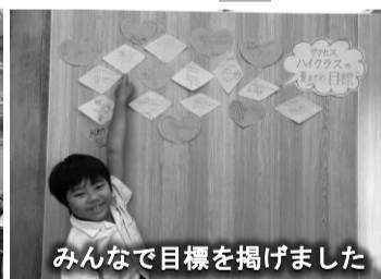
みんなで目標を掲げました