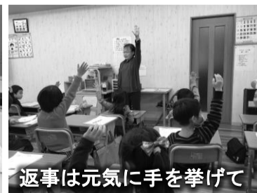
返事は元気に手を挙げて