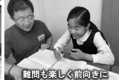
難問も楽しく前向きに