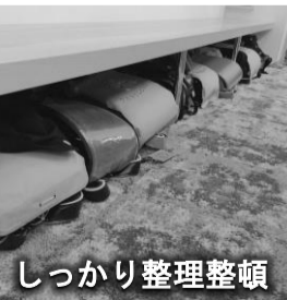
しっかり整理整頓