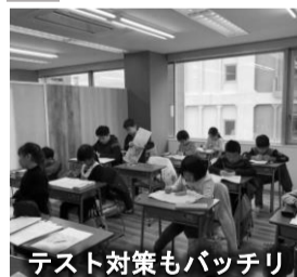
テスト対策もバッチリ

家での勉強をする時に、自分で時間をよく見て、計画的に進められるようになりました。数学や英語の勉強だけではなく、勉強方法などを細かく教えてもらえるから、計画をしっかり立てて勉強ができるようになりました。